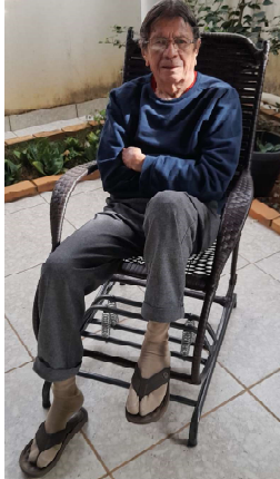
VELHO GD – Um flagrante do bom e velho GD (by e bota velho nisso), curtindo a aposentadoria numa nice