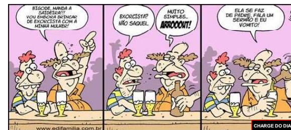
www.edifamilia.com.br CHARGE DO DIA