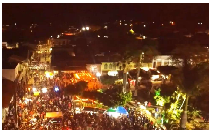
Ibiracatu espera receber visitantes de todas as regiões do estado nos três dias festa

A linguíça é feita artesanalmente somente com carnes de primeira e temperada com ingredientes tradicionais e preparada pelas famílias locais.