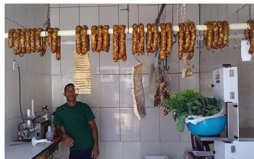
Famosa linguíça no pau super apreciada e comercializada