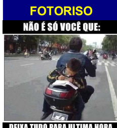
DEIXA TUDO PARA ULTIMA HORA.

Médico falando com o paciente moribundo: - E por que o senhor quer ser sepultado no mar? - É porque minha sogra jurou várias vezes que vai dançar sobre meu túmulo!