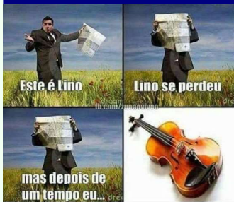
mas depois de um tempo eu...