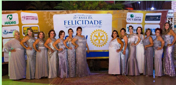
Integrantes do Rotary Club Leste