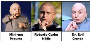
Mini-me Pequeno Roberto Carlos Médio Dr. Evil Grande