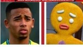
RICOITO (by Scherek) - GARRIFI JFSJUS