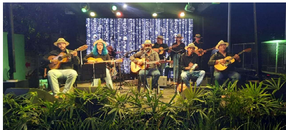
CENTRO HELI PENIDO – A espetacular Orquestra de Viola foi a atração musical à parte, na inauguração do Centro Cooperativo Heli Penido

DA edição 2024, da Festa Nacional da Banana, com diversas atrações nacional e com entrada gratuita. Chique demais! DE certas criaturas que se fazem de colegas/amiga(o)s, mas basta você dar as costas para levar a facada. Ufa!