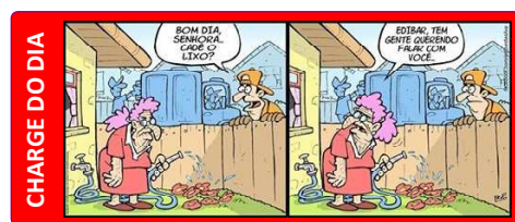
CHARGE DO DIA