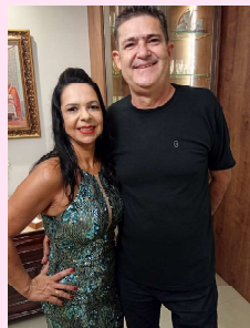
Eternos apaixonados. Acho lindo este amor!