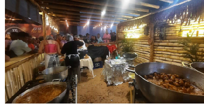
FESTA DA LINGUIÇA – Mais de uma tonelada de linguica foi distribuída gratuitamente para a população e visitantes que participaram da 21ª edição da Festa da Linguica de Ibracatu. Hummm... estava de lamber los beifones