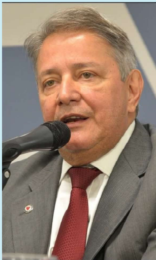
SEM NOVELA ou polémica, o médico Carlos Pimenta volta à cena política na Assembleia Legislativa de Minas