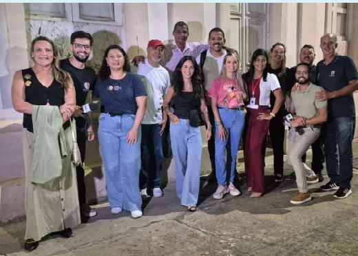
COMIDA DI BUTECO – Tchurma da imprensa promete comparecer em grande estilo na despedida do projeto Comida di Buteco, na próxima segunda-feira (25/5), com premiação dos melhores bares