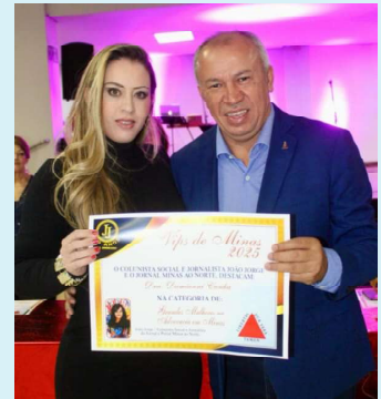
COM UMA das mais aplaudidas advogadas da nova geração, dra. Dani Cunha, o dep. federal Paulo Guedes, com grande prestígio na capital federal como um dos líderes do governo Lula e, na região, incansável na busca de recursos para a saúde